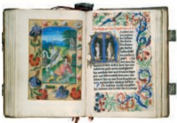
te zien in De Pest : Jongeman overvallen door de dood , Gebedenboek Meester van Hugo Jansz. van Woerden, met latere toevoegingen 1480–1490 en 1500–1510, perkament, zilver, Utrecht, Museum Catharijneconvent

voorwoord I uit het depot I tekenen voor het museum II vriendenactiviteiten II in memoriam III jaarverslag III tentoonstellingsprogramma IV