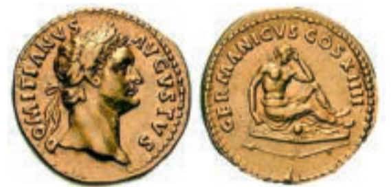
gouden munt met portret van Domitianus, geslagen in Rome in 82 na Chr. (collectie: Nationale Numismatische Collectie, De Nederlandsche Bank)