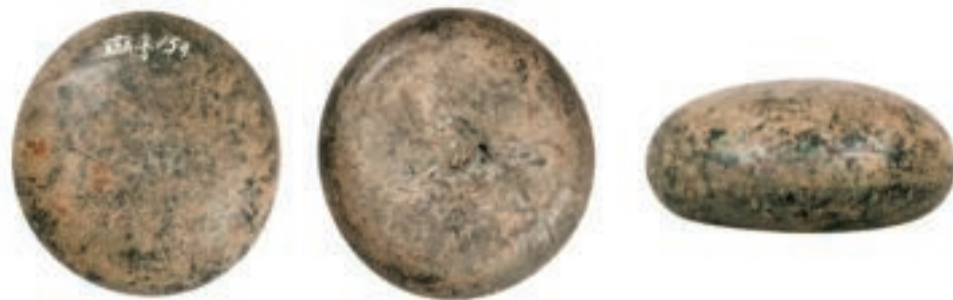
glas, Ø 9,5 cm, h 4cm

Deze afgeplatte massief glazen bol wordt ook wel slijksteen genoemd, naar het Noorse woord 'slikji', gladstrijken. Verreweg de meeste gevonden exemplaren zijn niet van steen maar van glas. Met zo'n bol konden linnen en wollen stoffen worden gestreken, geplet of gepolijst. Het strijkglas is de middeleeuwse voorloper van het strijkijzer. Ook toen al hield men niet van kreukels! Het voorwerp werd gemaakt door een klomp vloeibaar glas rond te draaien op een metalen plaat, of in een vorm gegoten. De kleur is meestal donkergroen of zwart, de kleur die ontstaat bij gebruik van onzuiver zand met een bepaald gehalte ijzer (groen) of ijzer en koper (zwart). Het oppervlak is geïriseerd door inwerking van de grond waar het glas eeuwenlang in verbleef.