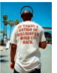
It Takes a Nation