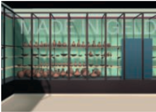
Ontwerp vitrine-inrichting door Jelena Stefanovic

Het architectenbureau Verlaan & Bouwstra is zorgvuldig te werk gegaan. Om de toegankelijkheid te waarborgen wordt tussen het oude museumgebouw en de dienstwoning rechts daarvan een nieuwe transparante liftkoker geplaatst die beide gebouwen in hun waarde laat. Via die aanbouw van glas en staal kom je op alle verdiepingen van het museum en van de dienstwoning (waar kantoren komen) terecht. De nieuwe aanbouw wordt de dagelijkse entree, maar op de dagen dat het gebouw open is voor publiek blijft de monumentale hoofdentree in gebruik.