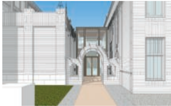
Ontwerpen voor de verbouwing door Verlaan & Bouwstra architecten

Ondanks alle technische vernieuwingen gaat het interieur weer lijken op vroeger: met weer collectie in de vitrines en gebaseerd op het oude kleurenschema dat bij kleurhistorisch onderzoek teruggevonden is. Er moet nog heel veel gebeuren, maar we werken gelukkig met een fijne, goeie ploeg mensen. Zo wordt de hele collectie op dit moment zorgvuldig ingepakt en verhuisd. Ook het contact met de provincie en de architect verloopt prettig. We willen graag open op 17 mei 2022, precies 100 jaar na de opening van Rijksmuseum Kam, en we hopen allemaal dat dat ook met de vertraging door corona gaat lukken.'